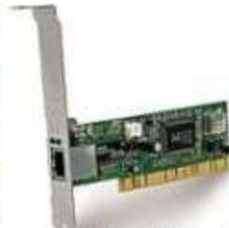
Network card NIC