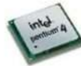
CPU or processor